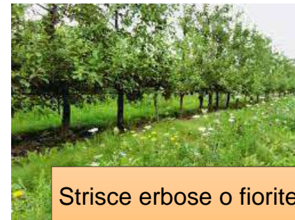
Strisce erbose o fiorite